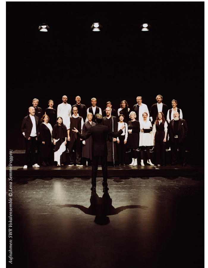
Aufnahmen: SWR Vokalensemble © Lena Semmelroggen